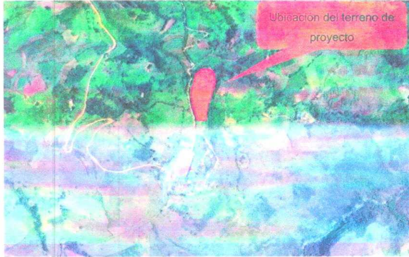
IMAGEN N° 02: Vista del Centro Poblado la Pampa