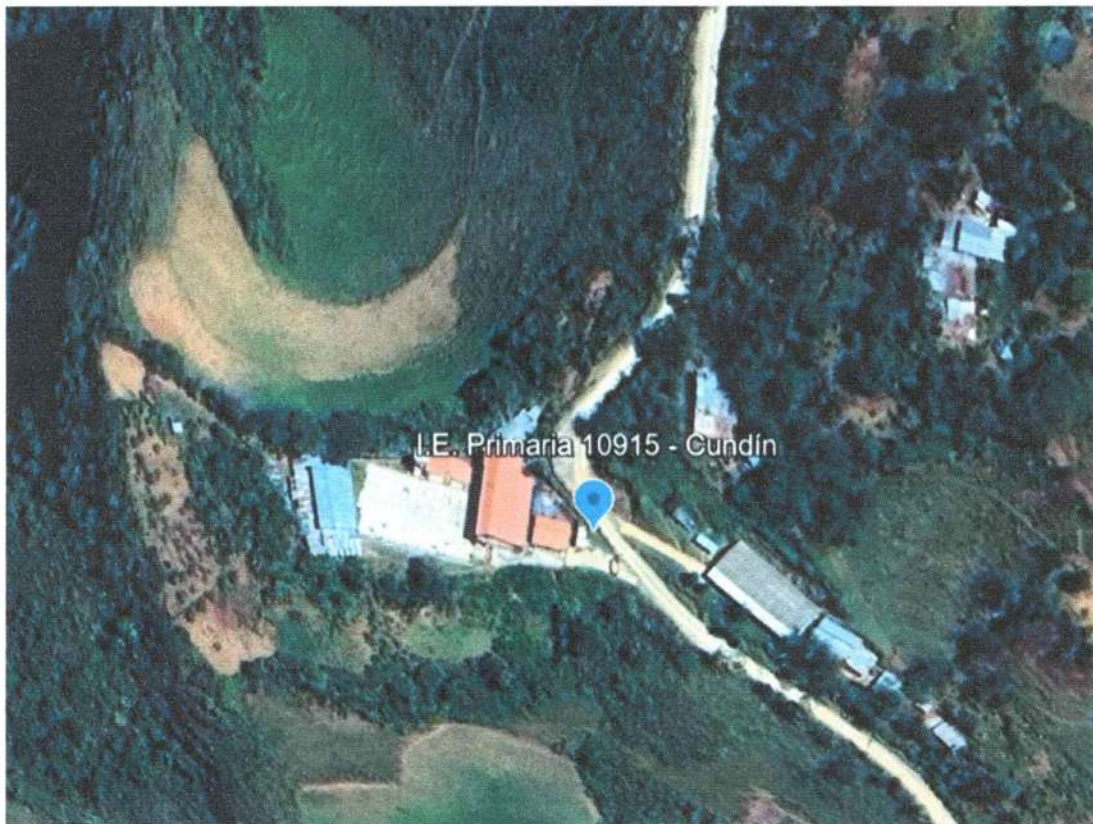
Imagen N° 02: Ubicación del área del proyecto