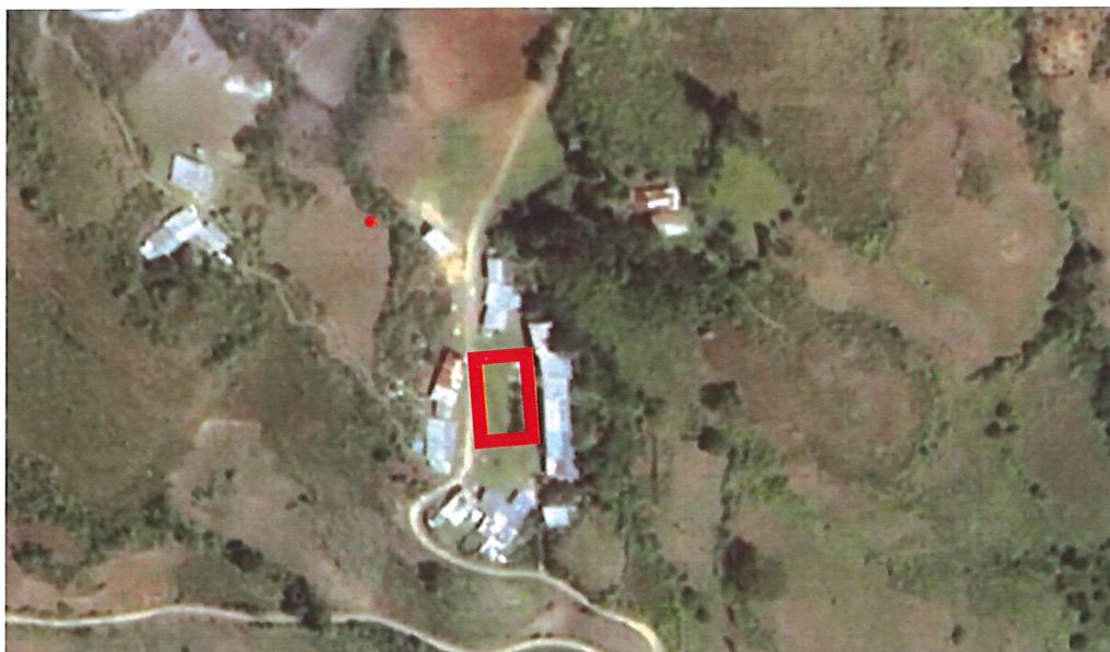
Figura 2. Ubicación del tramo para ejecución de la obra.