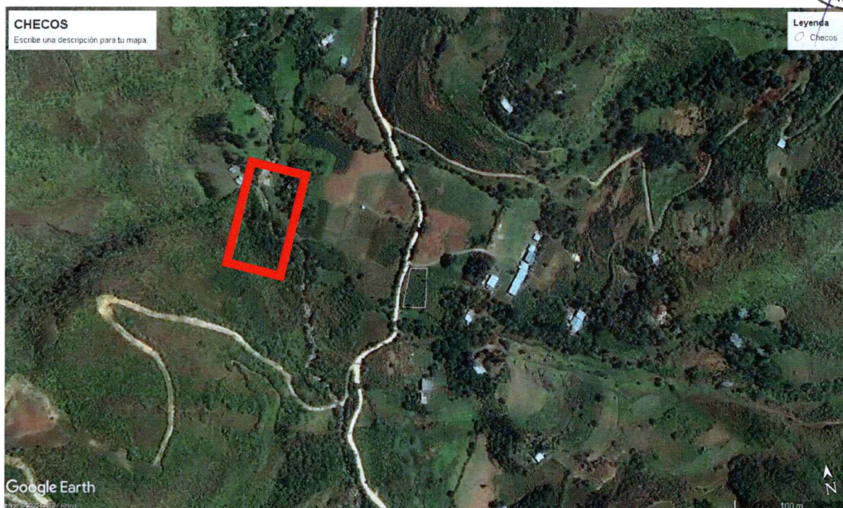
Figura 2. Ubicación del tramo para ejecución de la obra.